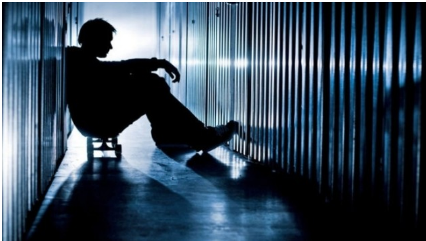
Un jeune homme souffrant de santé mentale