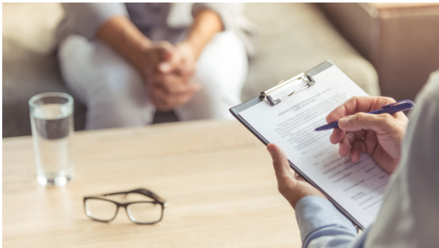
Des psychologues craignent la disparition de leur profession.