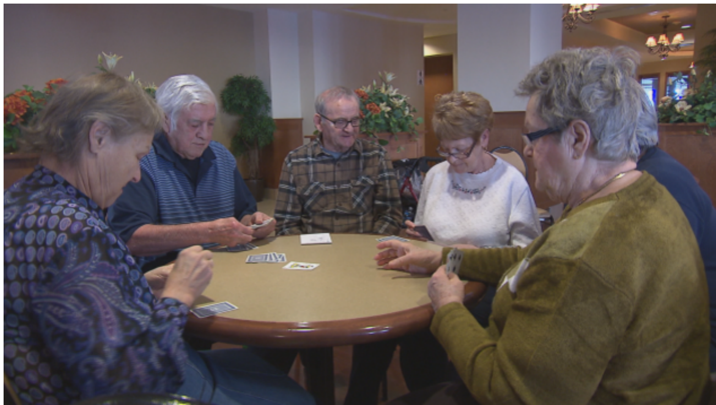
Selon le syndicat, les compressions dans les CHSLD privent des aînés de loisirs.