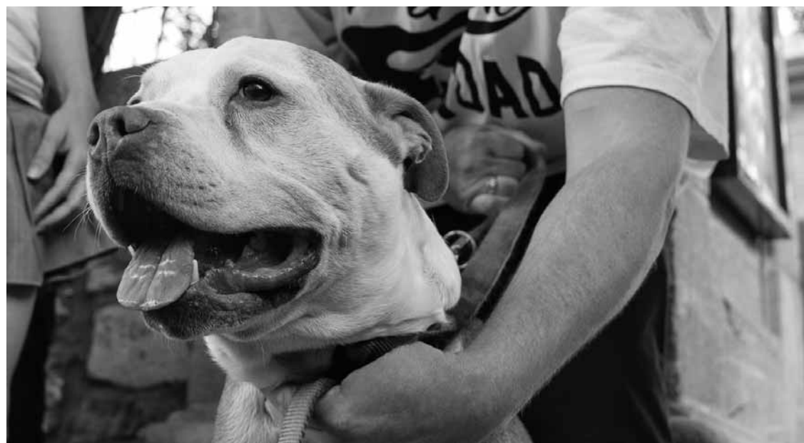
JACQUES NADEAU LE DEVOIR

Les gens qui possèdent déjà un pitbull pourront le conserver, à condition qu'ils n'aient pas commis